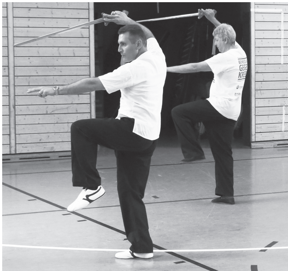
Tai Chi - Schwertform