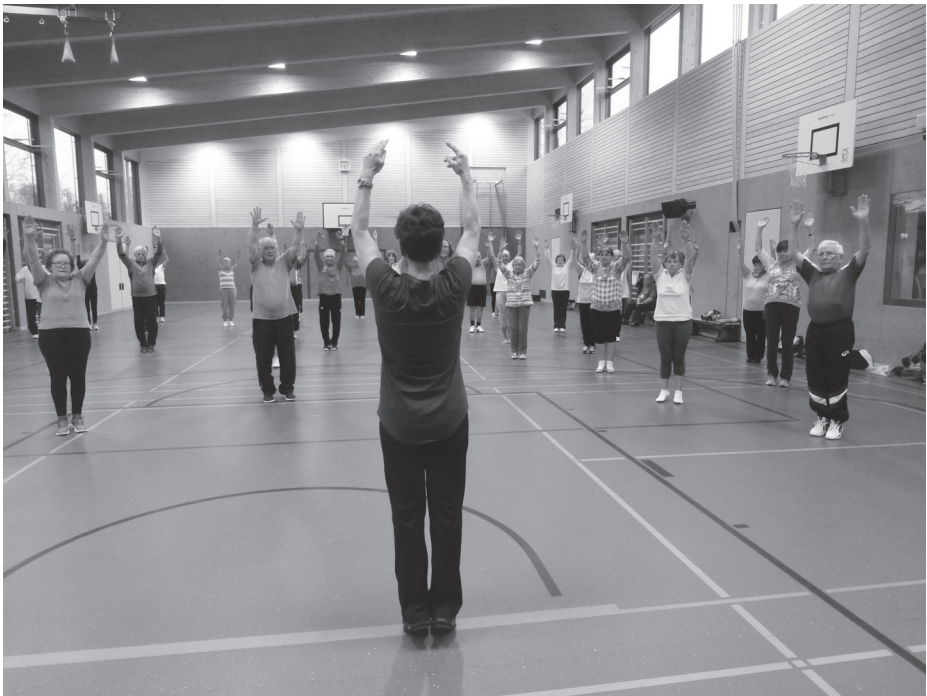
Die Übungsleiterin gibt das Kommando vor: „reckt euch, streckt euch“.