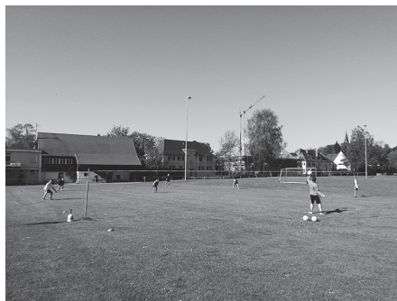
Faustball-Training am 1. Mai

Am 1. Mai gab es deshalb ein Sondertraining. Bei bestem Wetter ging es statt auf Wanderausfahrt auf den Sportplatz.