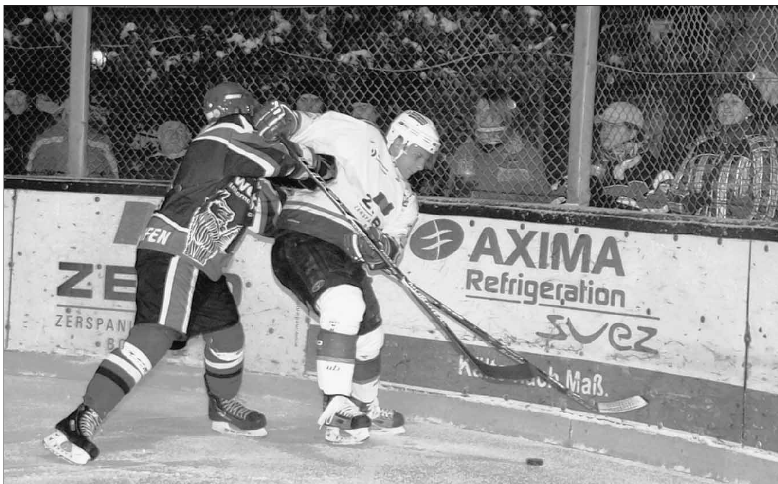
Am Wochenende müssen sich die Islanders noch einmal behaupten – es geht um Platz 2 in der Aufstiegsrundengruppe A.