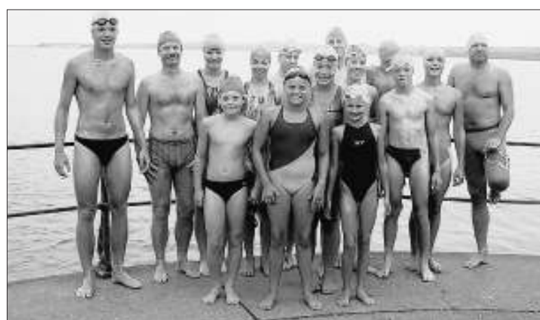
15 Schwimmerinnen und Schwimmer wagten den Start über die sechs Kilometer lange Strecke von Bregenz nach Lindau.