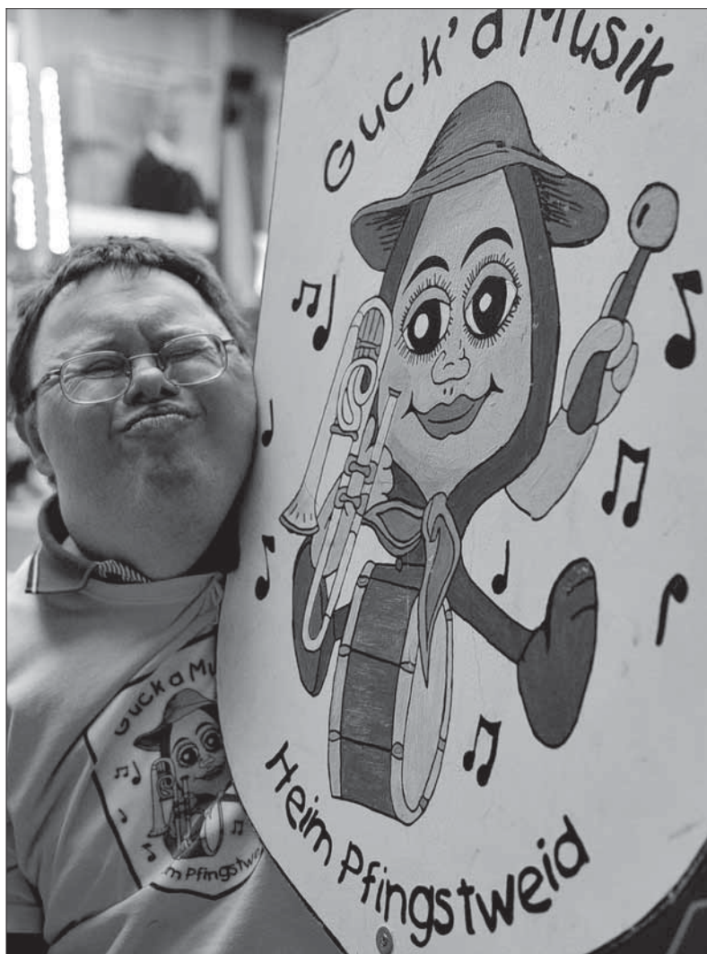
Die richtigen Töne: „Guck' a Musik“ vom Heim Pfingstweid sorgt am Samstag für Stimmung.