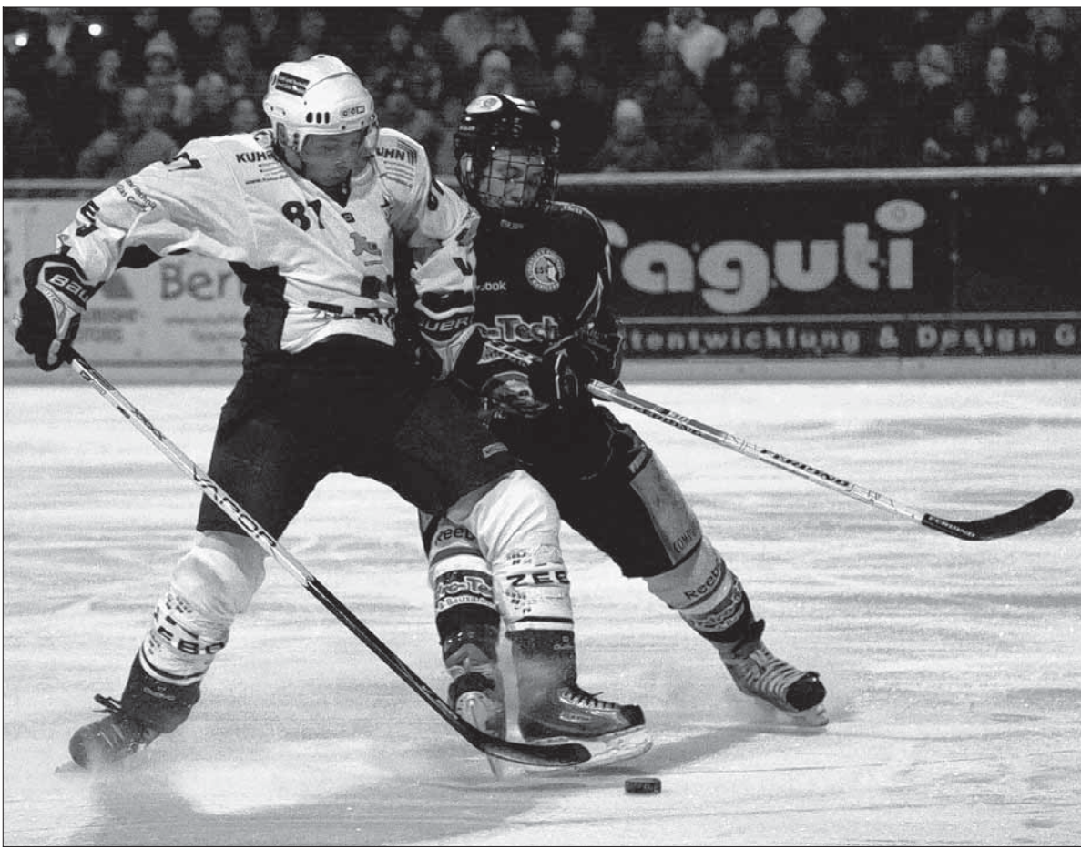
Ein Hauen und Stechen um jeden Zentimeter Eis: Das erwartet den EV Lindau (links) gegen Königsbrunn.

Dass die Islanders als sportliches Aushängeschild für das entsprechend gute Gefühl vor der Sommerpause sorgen wollen, liegt auf der Hand. Für den