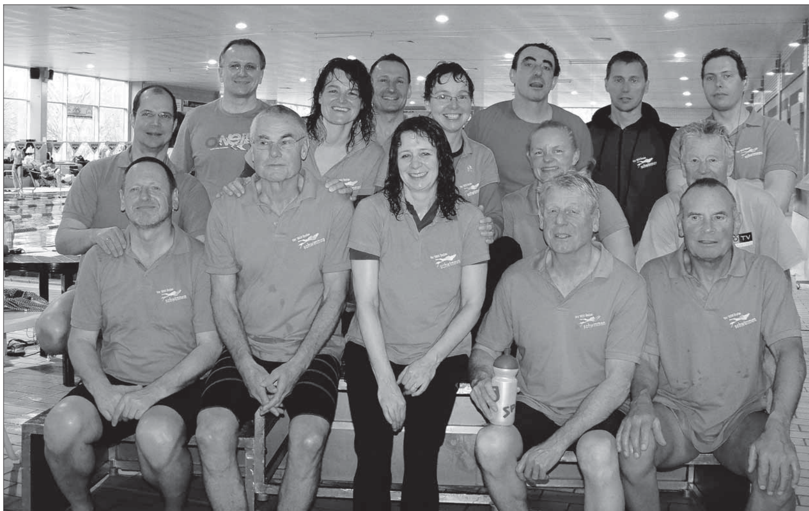
Zufriedene Gesichter zu tollen Leistungen: Die Schwimmer des TSV Lindau sammeln in Bayreuth richtig viele Medaillen.