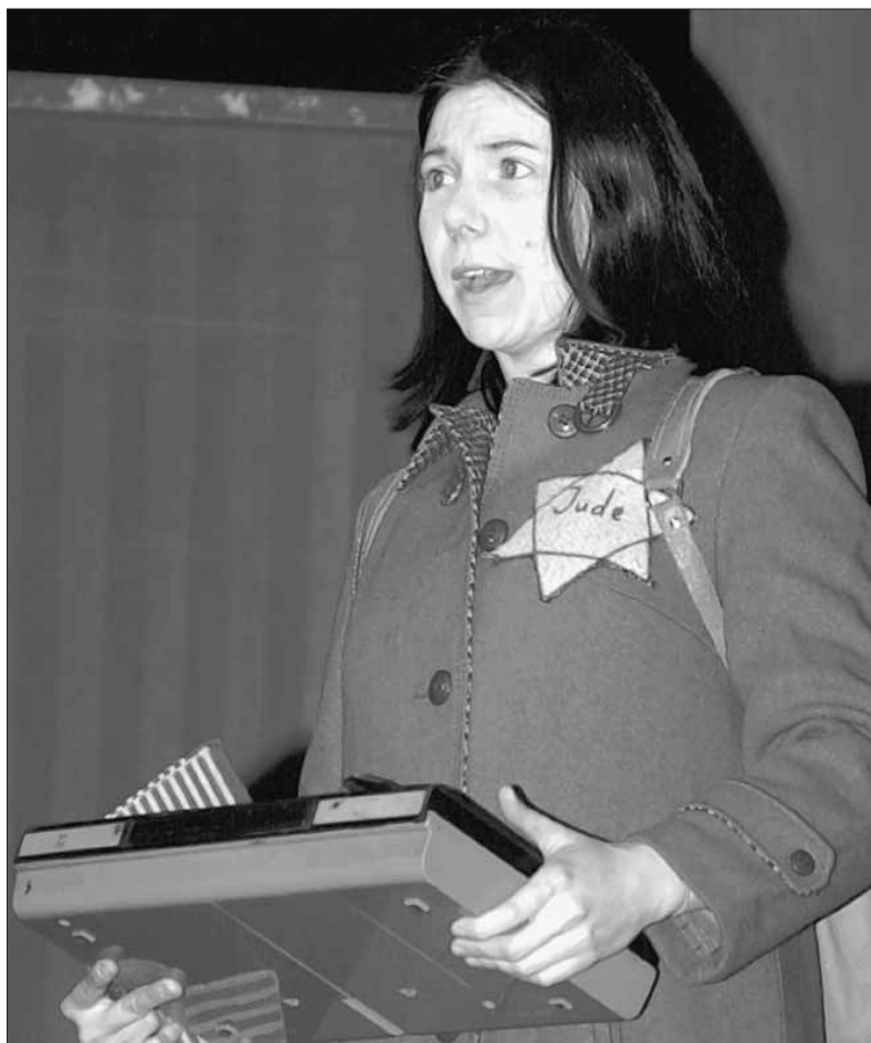
Anne Frank und ihr Tagebuch: Diese weltberühmte Geschichte hat eine Wiener Theatergruppe für Lindauer Berufsschüler aufgeführt.

Die Berufsschüler reagierten gelangweilt. Kaugummi schmatzend, grölend, pfeifend und mit Zwischenrufen war ihr Verhalten schlicht unangemessen. Unangemessen für den Besuch in einem Theater und ganz besonders im Andenken an die Gräueltaten der damaligen Zeit.