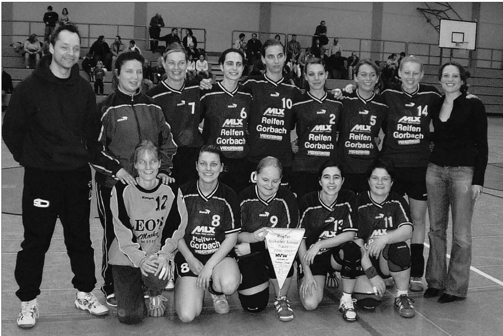
Lohn für eine tolle Saison: Die Handballdamen aus Lindau erhalten den verdienten Meisterwimpel.