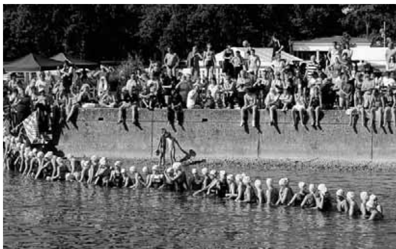
Auf die Plätze, fertig, los: Am 16. Juli stellen sich viele Schwimmer dieser Herausforderung.