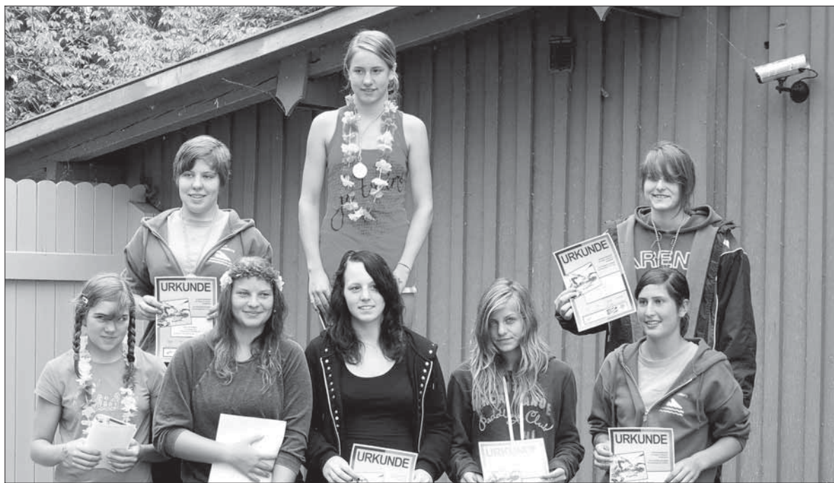
Stolz präsentieren sich die TSV-Nachwuchsschwimmer.

Mit dieser Veranstaltung begeben sich nun die meisten der Lindauer Schwimmer in die Sommerpause. Das offizielle, gemeinsame Training startet wieder Mitte September. Bis dahin werden wohl nur einzelne für Events trainieren.