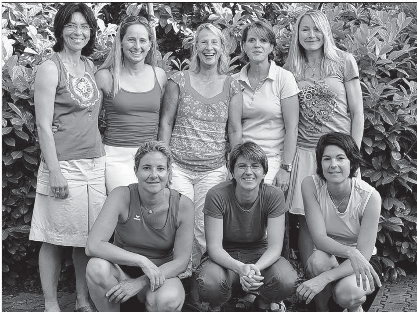
Die erfolgreichen Damen des TC Nonnenhorn freuen sich über ihre Meisterschaft.

Und auch die andere Mannschaft der Damen, nämlich die der Altersklasse 30, zeigten sich laut Pressebericht des TC Nonnenhorn, mit dem Saisonverlauf zufrieden und belegten am Ende einen guten dritten Platz in ihrer Staffel.