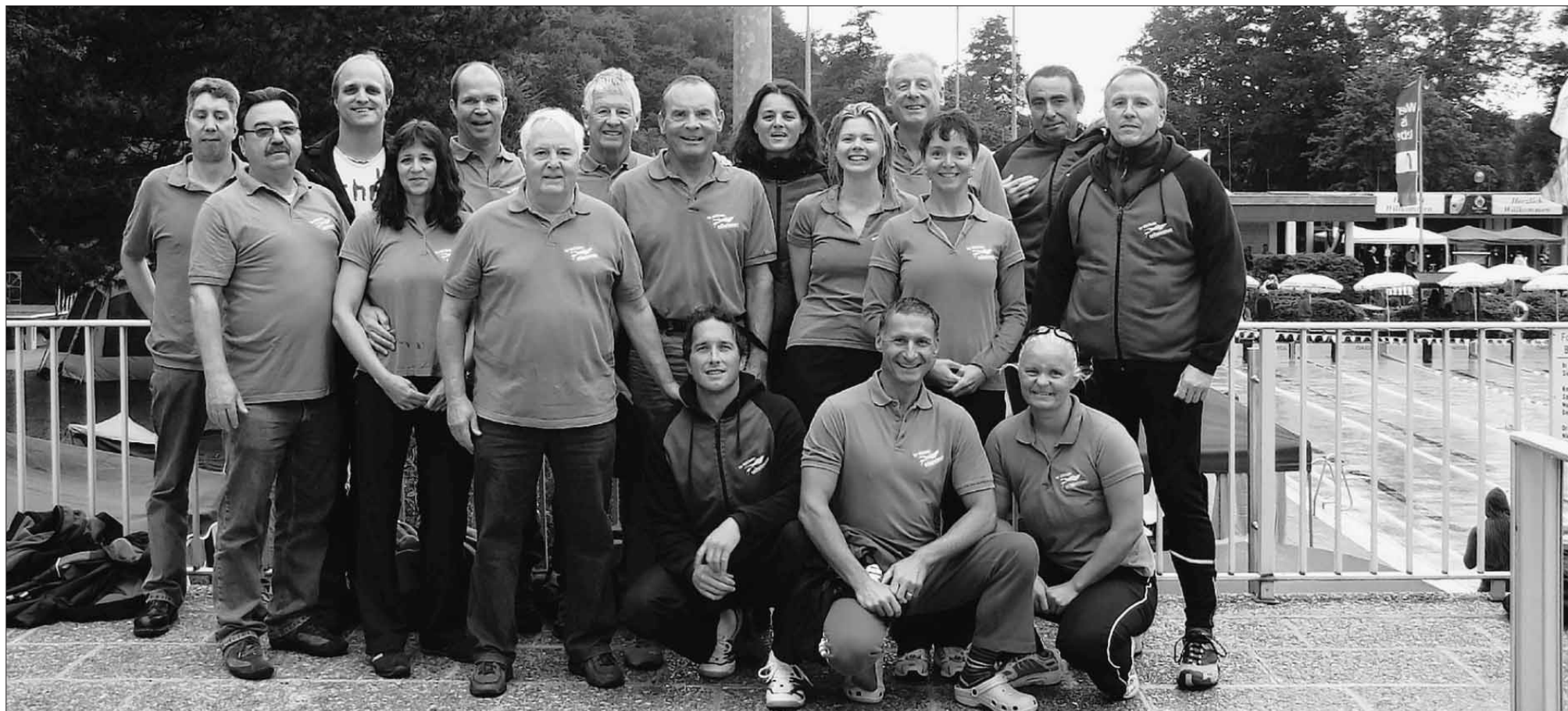
Kehren hochdekoriert vom Wettkampf in Kulmbach zurück: die Masters-Schwimmer des TSV Lindau.