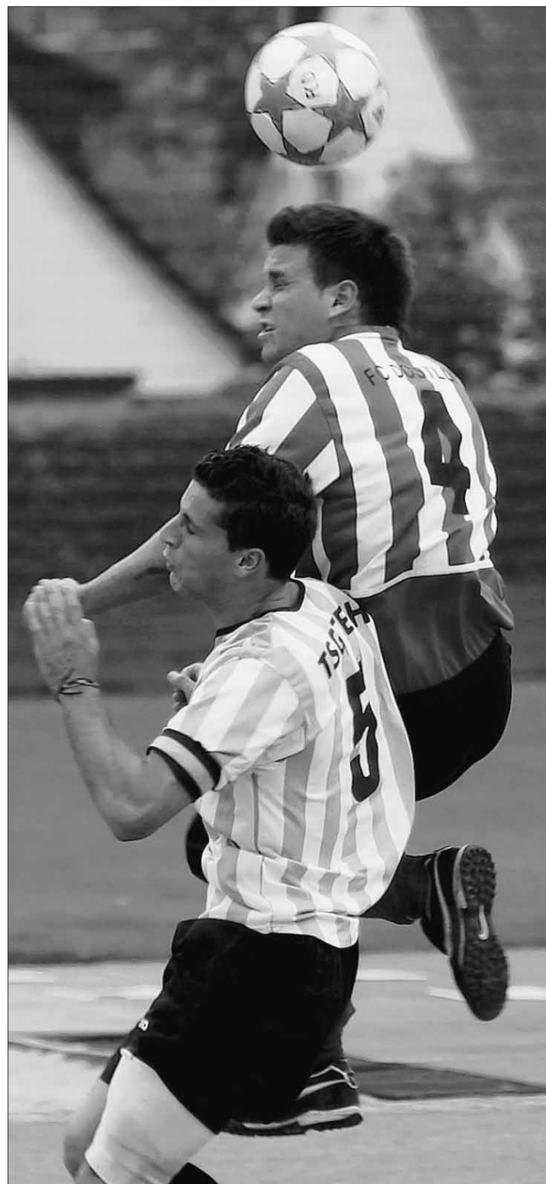
Der FC Dostluk war zuletzt obenauf und will auch morgen beim Tabellenletzten TSG Zech den nächsten Sieg feiern.

Sonntag, 15 Uhr: TSV Tettngang - FV Langenargen (13.15 Uhr), TSG Ailingen - VfL Brochenzell, SV Nonnenhorn - SG Argental, TSG Lindau-Zech - FC Dostluk, TSV Hege-Wasserburg - TSV Eriskirch, SpVgg Lindau - TSV Oberreitnau, VfB Friedrichshafen II - SV Tannau.