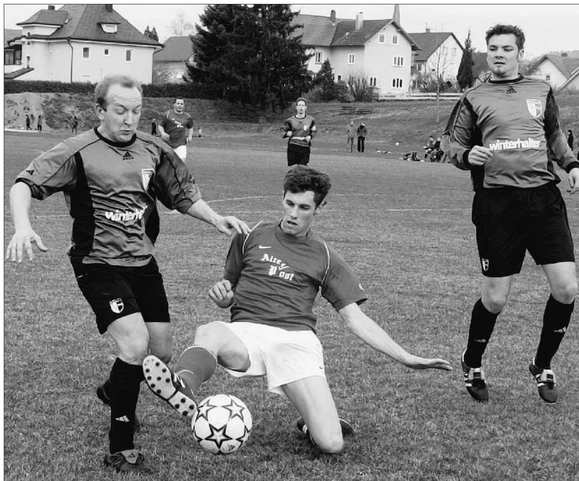
Der TSV Meckenbeuren (links) hat im Spitzenspiel gegen Hergensweiler nach guter Leistung nur ein 1:1 geschafft. Gegen Achberg soll der erste Dreier im neuen Jahr her.

Sonntag, 15 Uhr: SC Bürgermoos - SG TSV Hergensweiler/Niederstaufer, SC FN - SC Schnetzerhausen, SV Schmalegg - Croatia FN, TSV Schlachters - FC N, BC Bodolz - TSV Neukirch, TSV Meckenbeuren - SV Achberg, Sportfreunde - SV Ettenkirch.