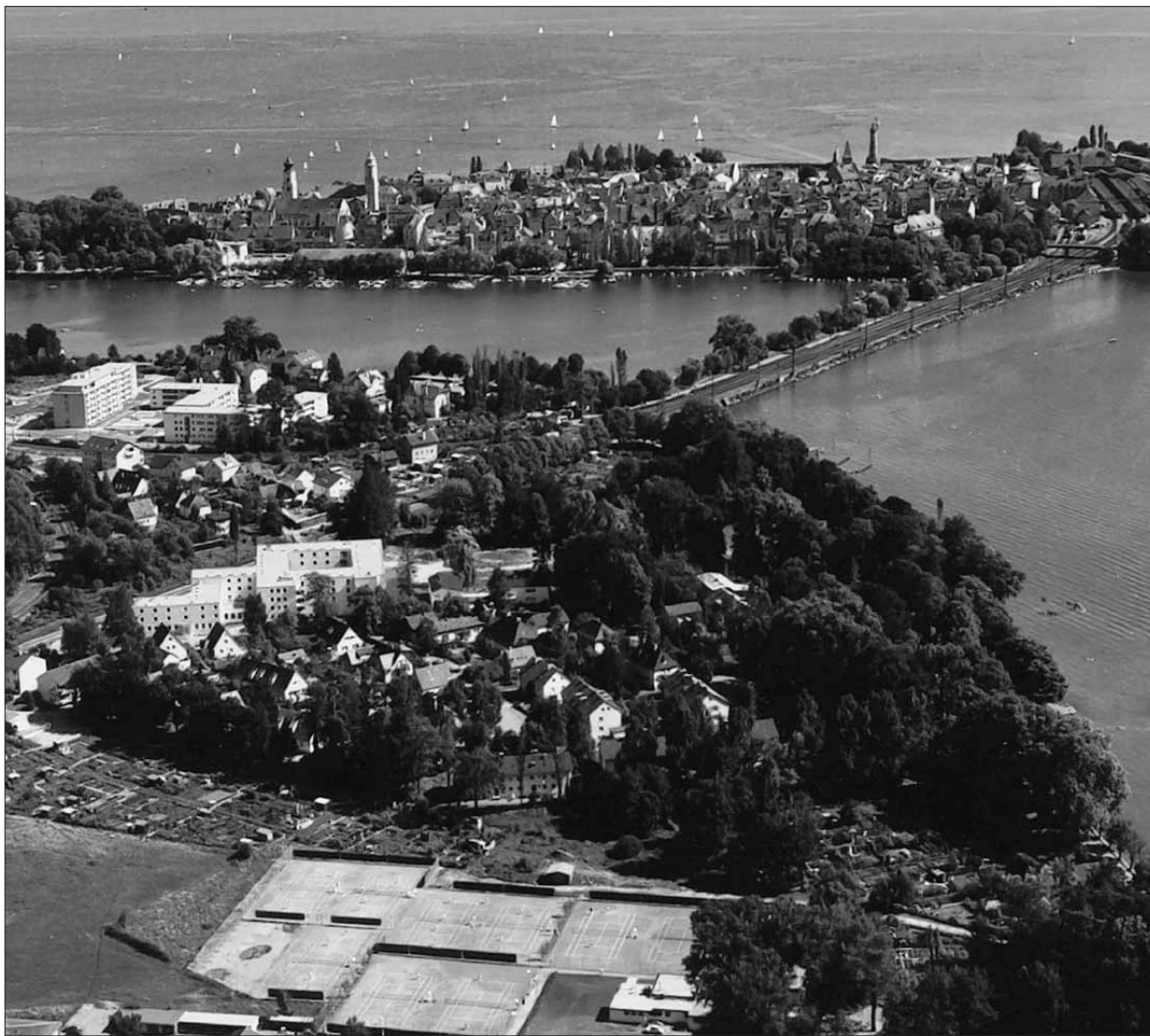
Diese wunderschöne Anlage ist die Heimstatt des Tennisclub Lindau. Am kommenden Wochenende feiert der TCL sein 75-jähriges Bestehen mit einer großen Gala.