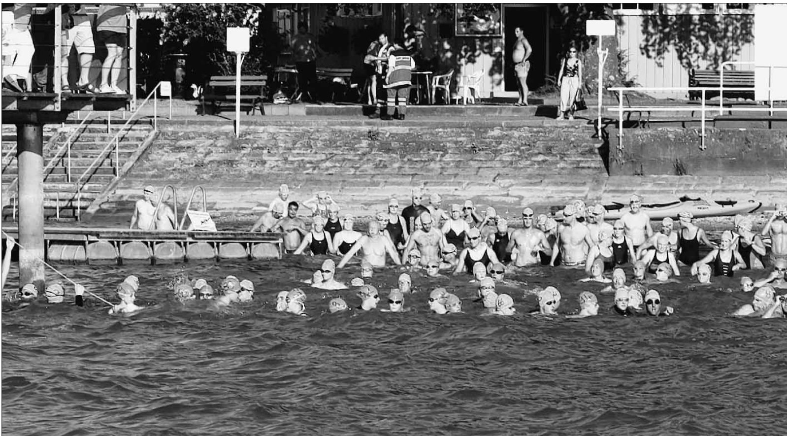
So früh ist im Römerbad selten so viel los: 120 Hartgesottene steigen um 8 Uhr ins Wasser, um ins Eichwaldbad zu schwimmen.