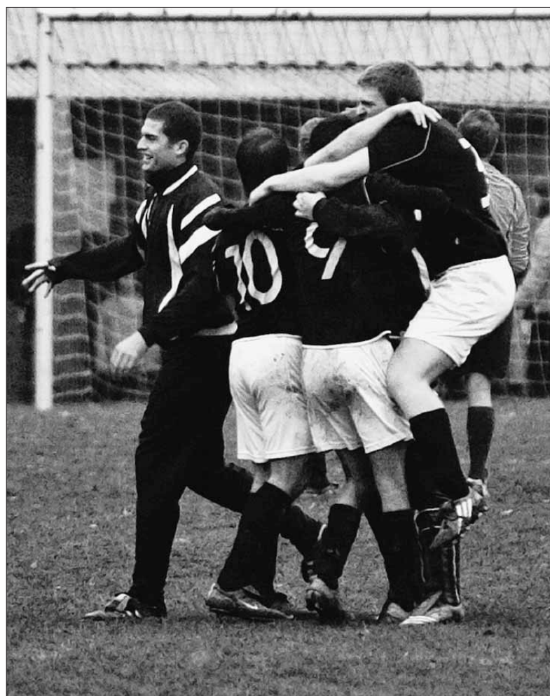
Wollen wieder jubeln: Spitzenreiter TSV Schlachters peilt am Wochenende gegen Bürgermoos den nächsten „Dreier“ an.

Aber auch die TSG Zech hat die Hoffnung auf die A-Liga noch nicht aufgegeben. „Ich will Zweiter werden“, sagt der neue Trainer Laki Tsaparas, „und die, die am Sonntag auf dem Platz stehen, wollen es auch.“ Für Tsaparas steht außer Frage, dass die