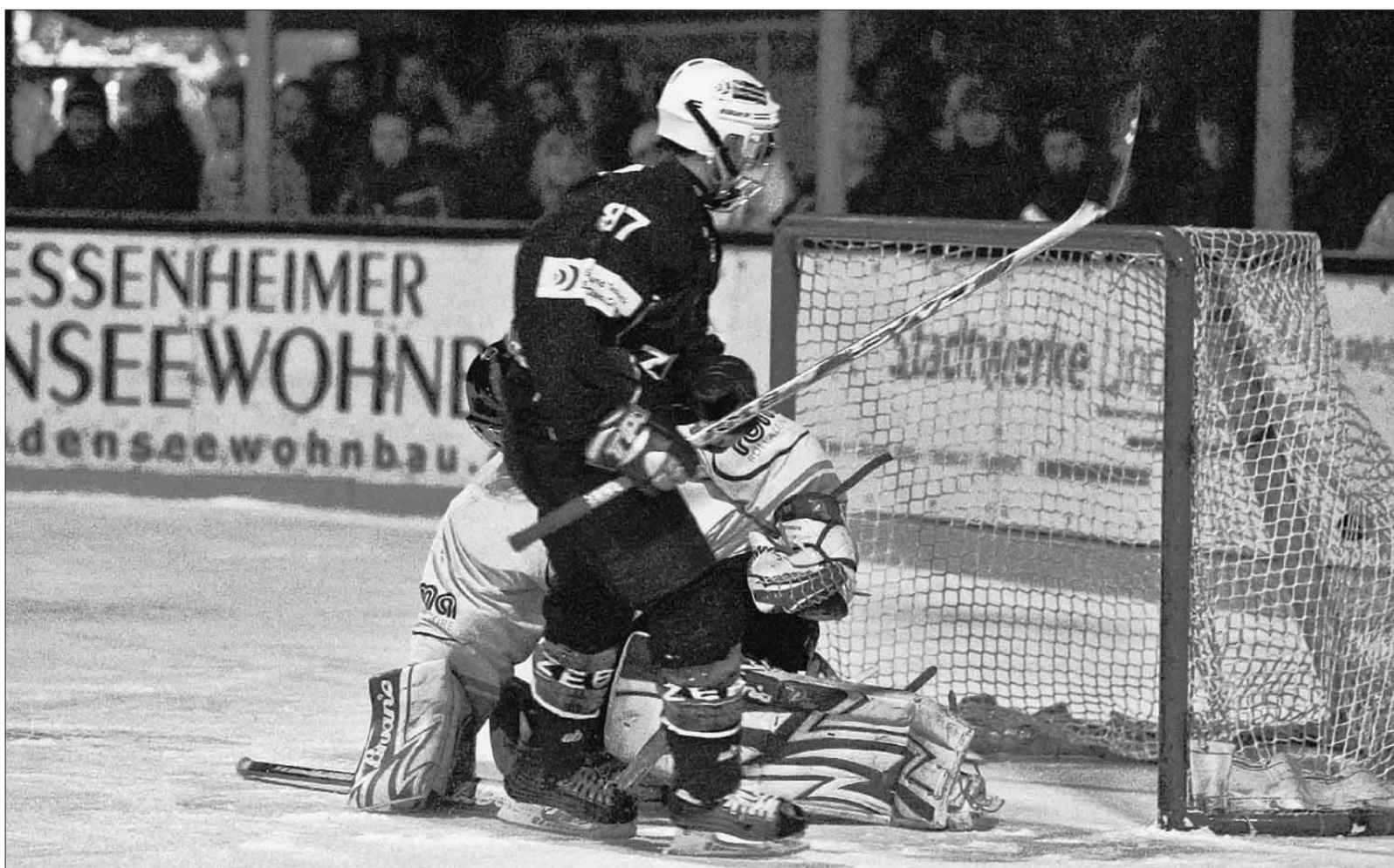
Die Zuschauer im Eichwald müssen sich bis zum 8. Februar gedulden, bevor die Mannschaft des EV Lindau wieder zu Hause spielt. Das Team des EV Lindau tritt dreimal in Folge auswärts an.